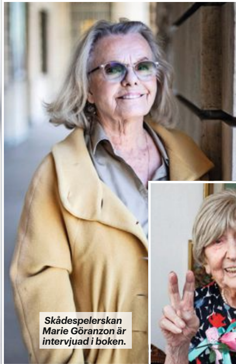
Skådespelerskan Marie Göranzon är intervjuad i boken.